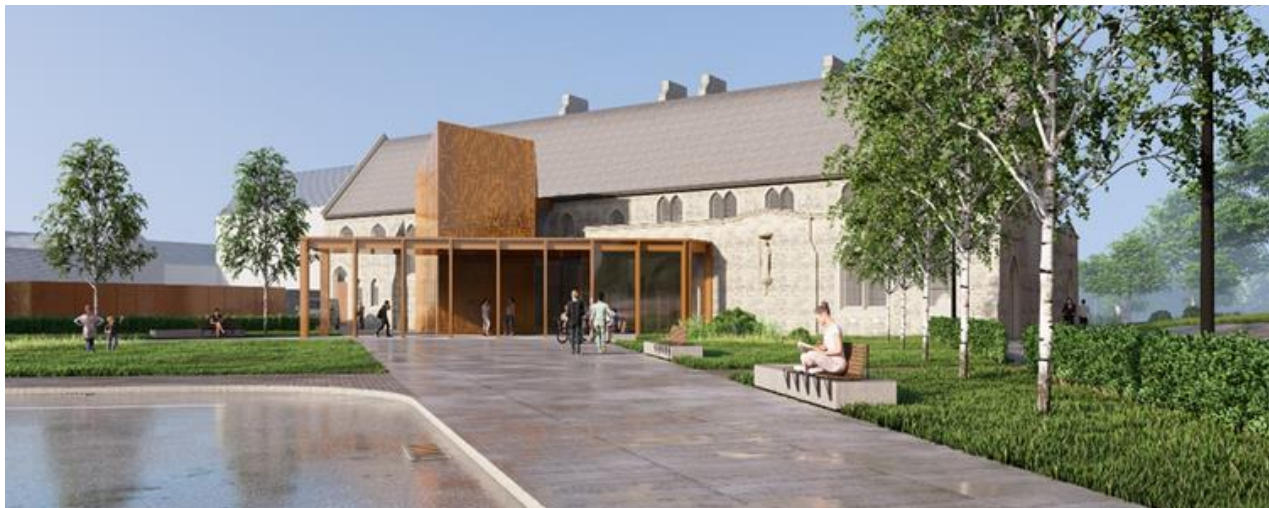
Artystyczna wizja terenu County Monaghan Thrive Site

Projekty muszą uwzględniać zasady Nowego Europejskiego Bauhausu – promować rozwiązania, które są zrównoważone, integracyjne i estetyczne.